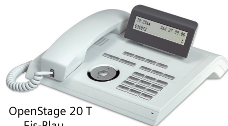
OpenStage 20 T Eis-Blau