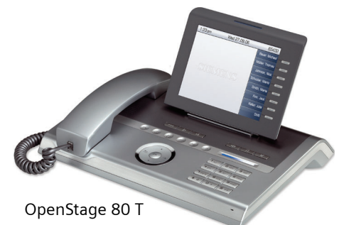
OpenStage 80 T