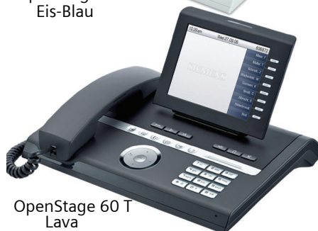
OpenStage 60 T Lava