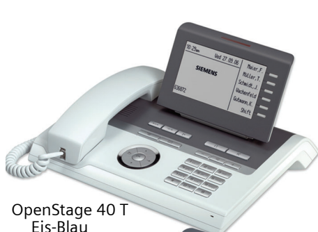
OpenStage 40 T Eis-Blau