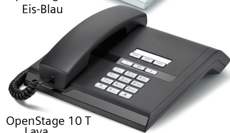
OpenStage 10 T Lava