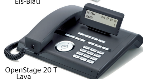
OpenStage 20 T Lava