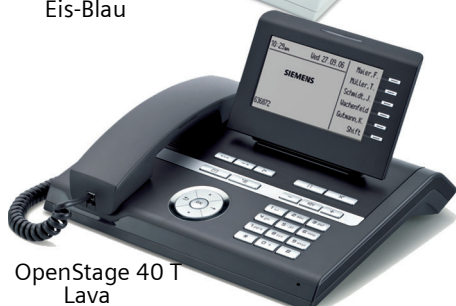
OpenStage 40 T Lava