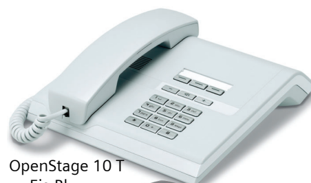
OpenStage 10 T Eis-Blau