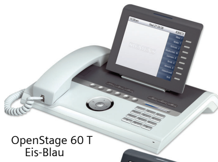
OpenStage 60 T Eis-Blau